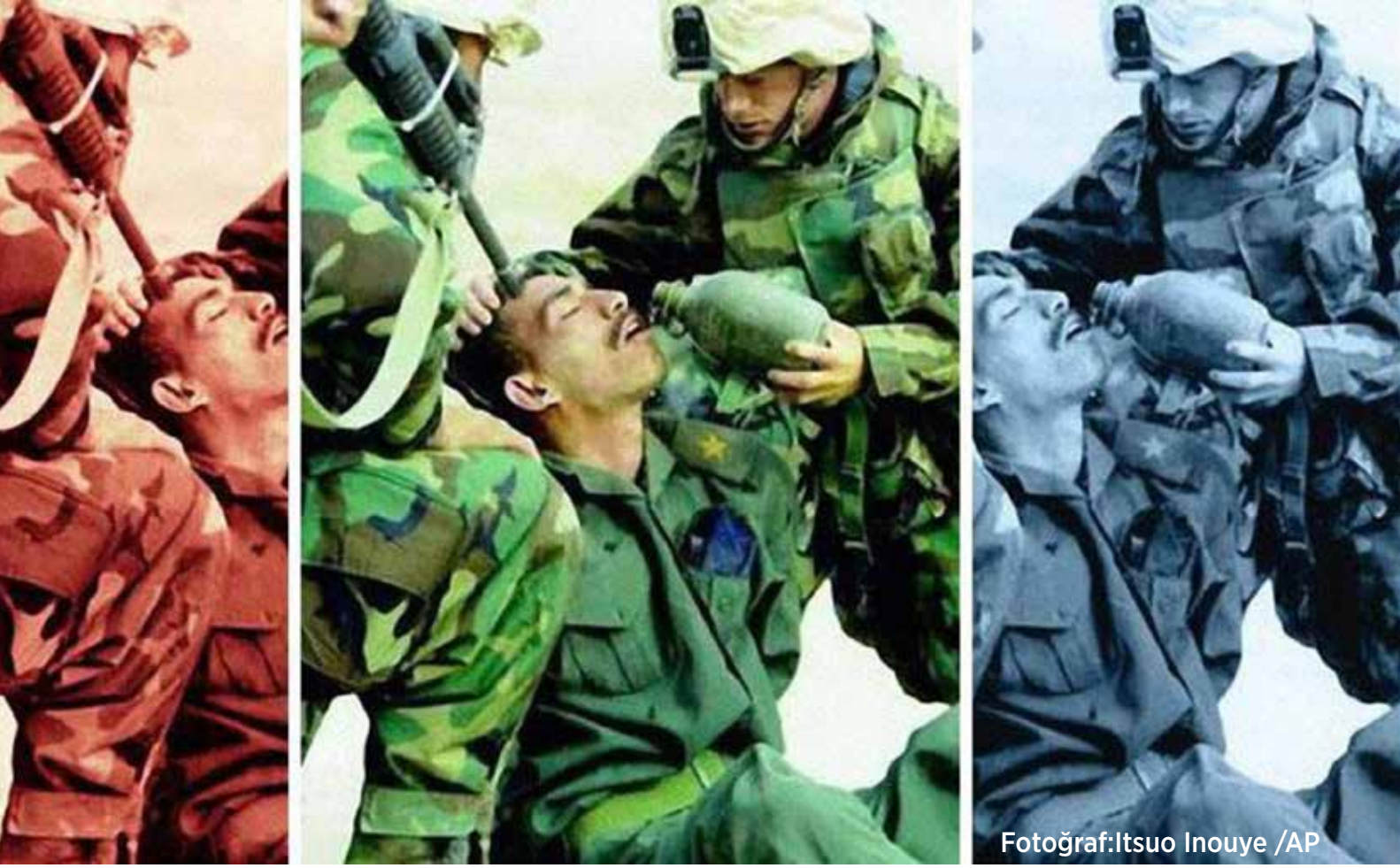
Amerikan askerleri 21 Mart 2003'te Irak'ın güneyinde Irak ordusundan bir askere su veriyorlar.

“Projeleriyle, reformlarıyla işte 2021”, “Ekonomi ve hukuk reformlarıyla demokrasi çitası yükselecek”, “Türkiye ile Avrupa Birliği ilişkileri yeni bir kulvara girecek”, “2021’in Türkiye’de yatırım, üretim ve özgürlükler bakımından şahlanışa geçeceği bir yıl olacak” başlıklı; “Felaketlerle geçen 2020 bitterken, gelmeye başlayan olumlu işaretler bu yıl için umutları daha da büyüttü” ibareli çok sayıda haber okuduk, televizyon kanalları aracılığıyla dinledik. Burada somutlaştırmak için yayın kuruluşu da belirtmek gerek. Akşam gazetesinin yılın ilk haftasındaki bir haberinde, “Ekonomide uluslararası güvenle birlikte dövizdeki düşüş sürecek; üretim, ihracat ve iç ticaret büyüyecek. Suriye, Libya ve Karabağ’da Türkiye’nin adımlarıyla sağlanan ‘çatışmasızlık’ kalıcı çözüm fırsatı sunuyor” ifadelerini hatırlatmadan geçmek olmaz. 2021 yılının sonuna geldiğimizde “dövizdeki düşüş sürecek” cümlesinin ne kadar gerçek dışı olduğu, ekonomide gelişmelerle net olarak görüldü. “Hiçbir gerçek haberin önüne geçemez” görüşü, gazetecilik ilkelerinden gittikçe uzaklaşanlar tarafından 2021 yılı boyunca tersine çevrildi ve siyasal-sosyal her gelişme sonrası haberler gerçeklikten uzaklaştıkça uzaklaştı. Diğer taraftan ekonomideki bu olumsuz gidişe, halkın daha fazla sıkıntı yaşamasına “sevinmek” de medyanın görevi değildir, olmamalıdır.