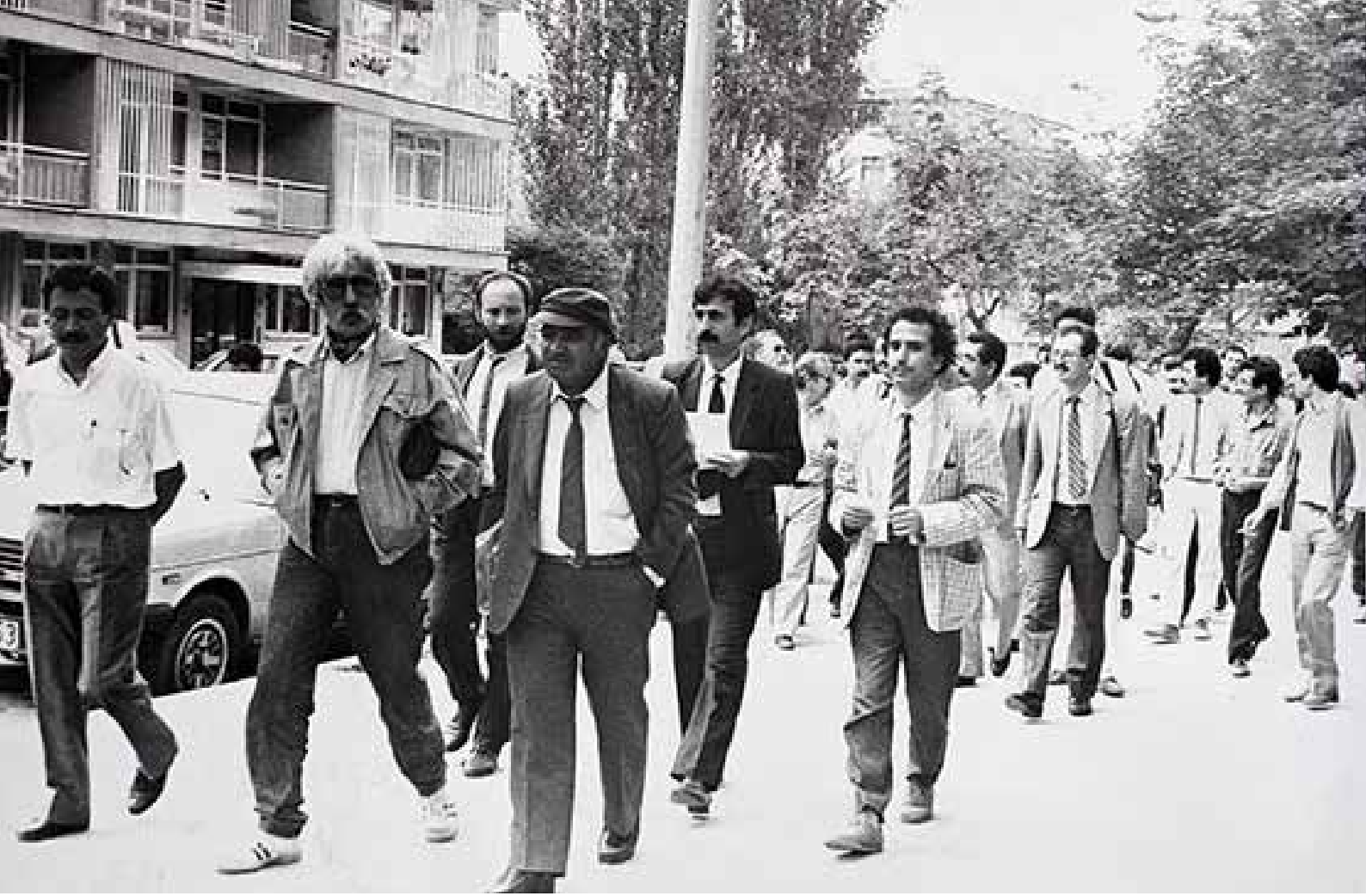
1 Temmuz 1988 - Gazetecilere yönelik baskıları protesto eden ÇGD üyeleri, DGM Başsavcısına uyarı mektubu vermek için Çevre Sokak'ta bulunan DGM'ye yürürken

Derneği, o da zaten MHP güdümünde varlığını sürdürüyordu. Dolayısıyla Çağdaş Gazeteciler Derneği, o zaman gerçek anlamda bir çekim merkezi oldu.”