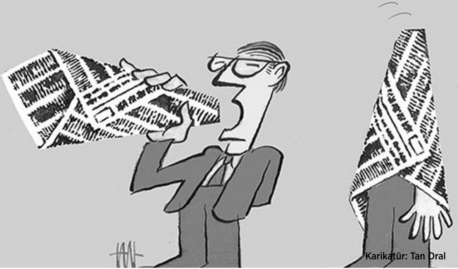
Karikatür: Tan Oral

bağımsızlık, laiklik, hukuk devleti, demokrasi ve insan hakları kavramlarının yer aldığı, yedi maddelik temel ilkeler açıklandı.