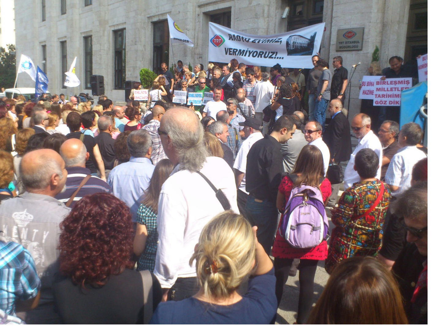
1949 yılından itibaren İstanbul Radyoevi olarak kullanılan Şişli-Harbiye'deki binanın, Birleşmiş Milletler'e tahsis edilmesi yönündeki girişimlere karşı TRT çalışanlarının 2012 yılında gerçekleştirdiği eylemden.

Bu kararnameyle TRT'nin yönetim yapısında da köklü bir değişiklik olmuştur.