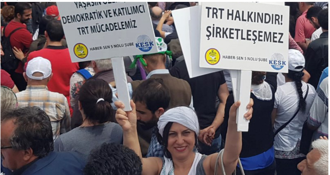
1 Mayıs İşçi Bayramı kapsamında İstanbul'da 2019 yılında düzenlenen mitingten.