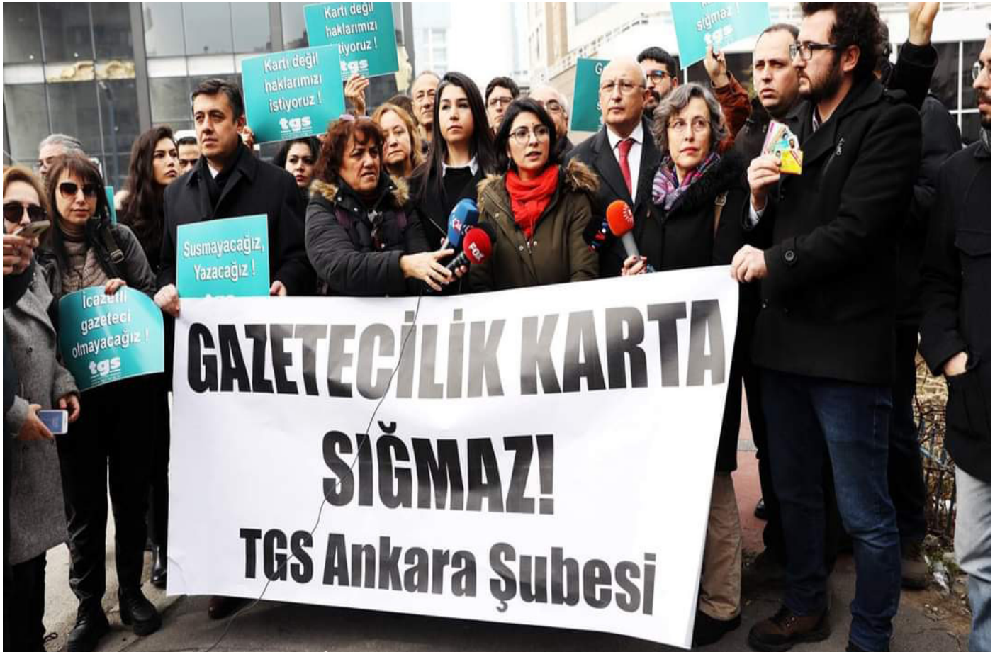
Gazetecilik meslek örgütlerinin öncülüğünde Cumhurbaşkanlığı İletişim Başkanlığının Ankara’daki binasının önünde 27 Ocak 2020 tarihinde düzenlenen eylemden.

(*) Dönemin Evrensel Gazetesi Başbakanlık Muhabiri