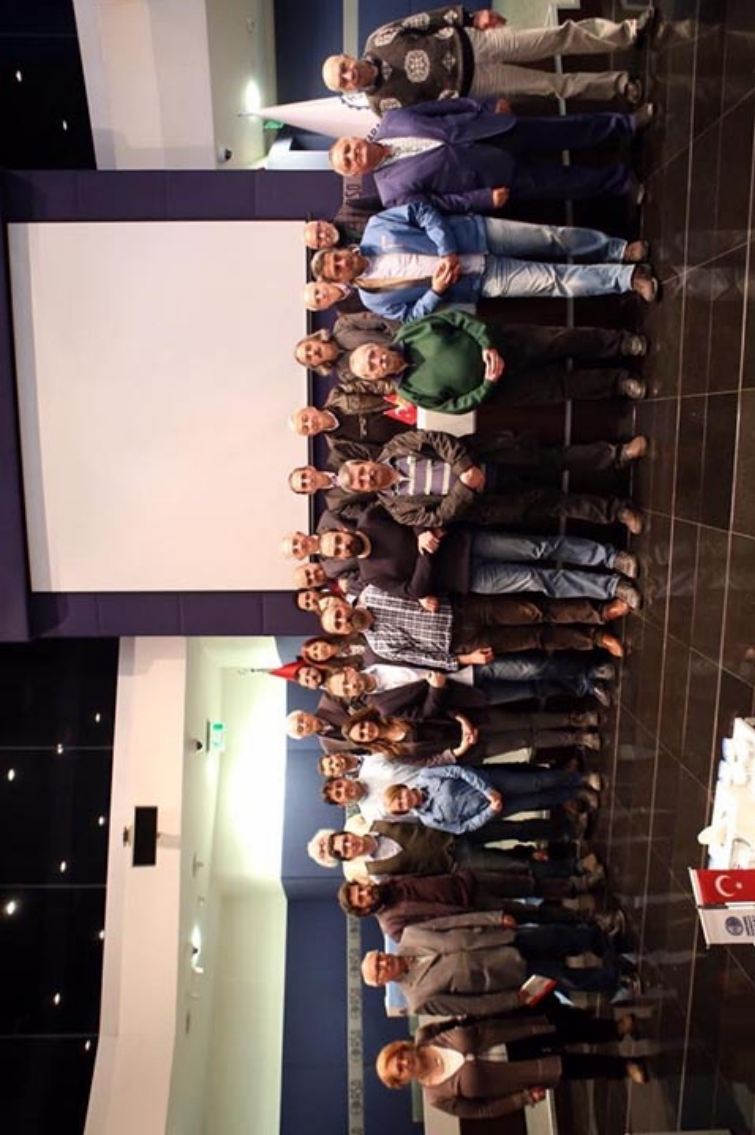
ÇGD 23. Dönem yönetimi göreve başladı (22 Nisan 2017).